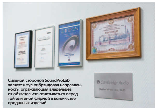
Сильной стороной SoundProLab является мультибрендовая направленность, ограждающая владельцев от обязательств отчитываться перед той или иной фирмой в количестве проданных изделий

ловиям демонстрационные залы, где всегда в наличии несколько вариантов источников звука, усилительных и декодирующих устройств, а также акустических систем. Один из этих залов, оснащенный проектором Runco 710 и экраном Draper 192, отдан под краткие киносеансы, вызывающие у посетителей острую зависть качеством «картинки» и звуковыми изысками. Второй предназначен тем, кто решил потратить время на тщательный подбор системы для воспроизведения музыки. Составление того или иного тракта занимает не более пятнадцати минут, в чем я убедился, наблюдая за бойкой работой консультантов, которые помогли средних лет гражданину определиться со стереопарой.